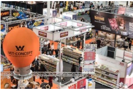
DOGLIVE 2024: Start der beliebten Hundemesse in Münster mit jeder Menge spannender Aktionsflächen für Hund und Mensch.