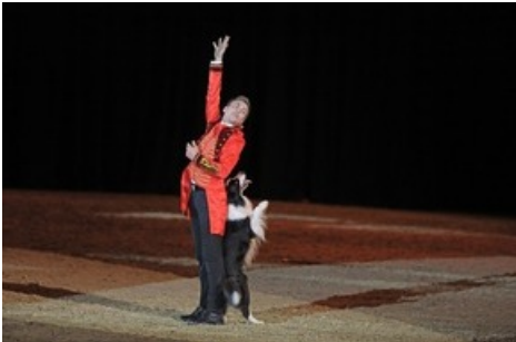
Die DOGLIVE Gala am Abend des 20. Januar verspricht ein abwechslungsreiches Programm mit Hunde-Comedy, Dogdance und Trickdogging. Auch dabei: die Stars Lukas Pratschker und Falco. Sichern Sie sich jetzt noch letzte Tickets!